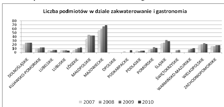
Rysunek 1 Liczba podmiotów w dziale zakwaterowanie i gastronomia w latach 2007-2010

Źródło: Opracowanie własne na podstawie: Działalność przedsiębiorstw niefinansowych w 2010 roku, Warszawa GUS, 2011